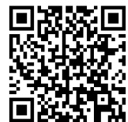
Kuva 3 QR-koodi: mobilepay.fi