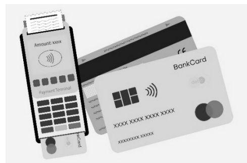
Kuva 1. Lähimaksupäätte ja maksukortti

Turvallisuussyistä maksupäätte pyytää satunnaisesti tunnuslukua, jolloin kortti pitää asettaa maksupäätteelle.